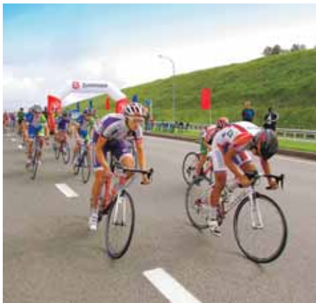
На фото: групповая гонка юношей 2000-2001 г.р.