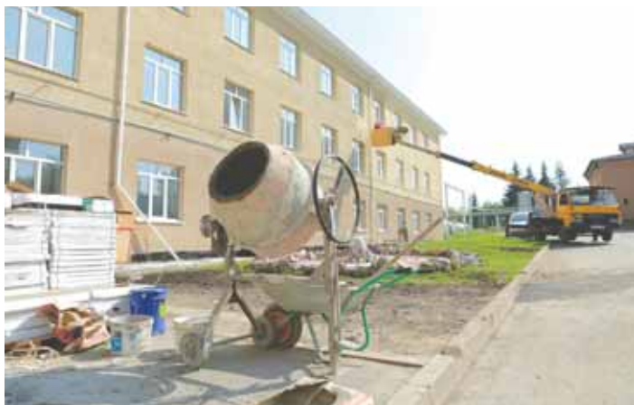
На фото: здание реконструируемого педиатрического отделения областной больницы.

В настоящее время заканчивается и ремонт Казачьего тракта, который соединит микрорайон Южный с Ленинским районом, а также даёт возможность для автомобильного транспорта выезжать с Южного на трассу Кемерово – Новокузнецк, минуя улицу Тухачевского, что значительно снизит нагрузку