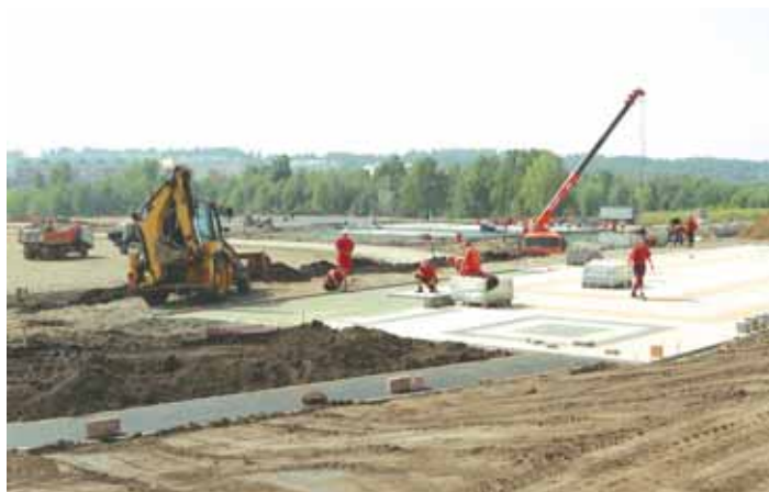
На фото: открытый спортивный комплекс школы № 85.