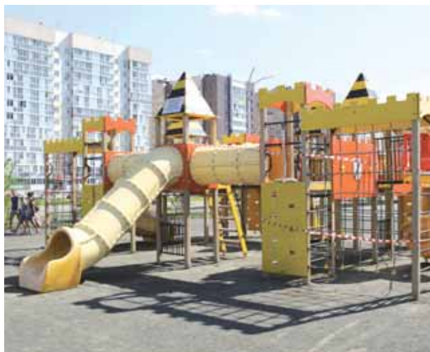
На фото: этот игровой комплекс переехал в парк Дружбы народов с площади Советов на радость ребятам Рудничного района.

На площади Советов завершён монтаж детского игрового комплекса. Средства на его приобретение перечислили муниципальные образования Кемеровской области в рамках подготовки к всекузбасскому празднику.