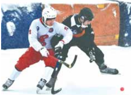
На фото: по новой формуле в следующем сезоне «Кузбасс» сыграет с действующим чемпионом «Енисеем» минимум четыре раза, а возможно, аж одиннадцать!

Так что заложенный сейчас фундамент очень пригодится «Кузбассу» в насыщенном напряжёнными играми сезоне. Очень хочется, чтобы выпавший при жеребьевке для формирования расписания матчей номер 2 был как можно ближе к реальному месту по итогам следующего волейбольного года. Сергей СОСЕДОВ.