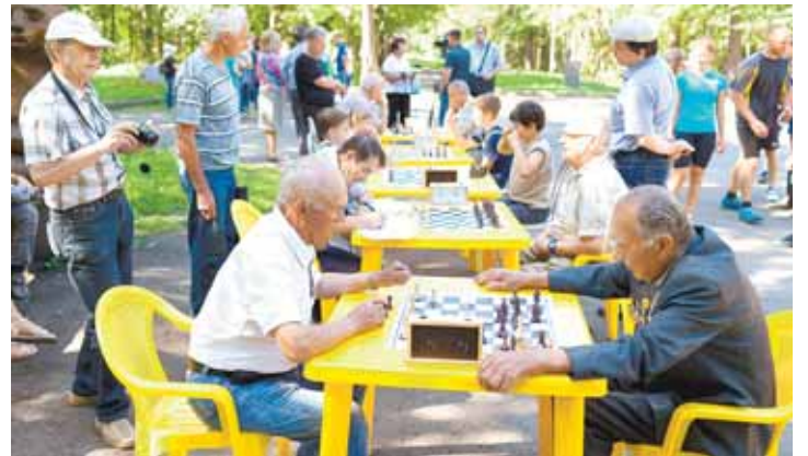
На фото: турнир в Сосновом бору.

5 августа в Рудничном районе состоялся необычный шахматный турнир. За столики для премудрой игры сели стар и млад.