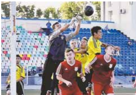
На фото: «Полимер» под кемеровским прессом.

И всё-таки, несмотря на отсутствие победы в первом матче, «СДЮСШОР-Кемерово», наверное, стоило бы назвать победителем. За упорство, за то, что не опускали руки. В игре с «Полимером» дважды уступали в счёте – и всё-таки на последних минутах сравняли его. С «Бийском» удавалось забивать первыми, но гости почти сразу сравнивали счёт; но, когда казалось, что дело закончится ничьей, а судья запустил на своём секундомере отсчёт добавленных трёх минут,