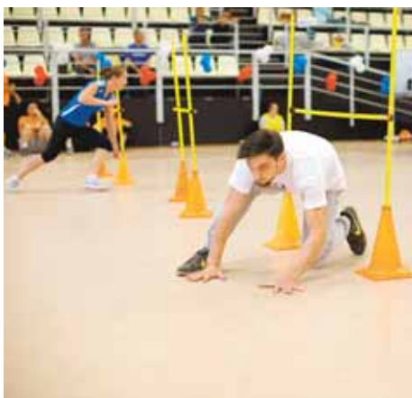
На фото: непростая эстафета.

Девушки (2000 г.р. и младше). 1. ДЮСШ № 5 (Кемерово). «Полысаево». 3. «Хэш Тэг 25-я» (Кемерово).