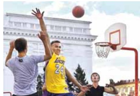
На фото: жаркий финал «Спайс Джим» – ДЮСШ № 2 «Невада».

Традиционная спартакиада спортучреждений города вновь показала себя максималистской по духу. ☑