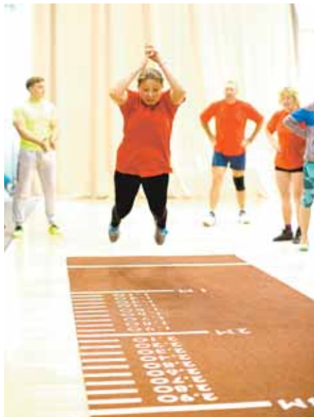
На фото: прыжки не на месте.

Завершился же этот день самой спортивной спартакиады города, участниками которой являются сотрудники муниципальных учреждений спортив-