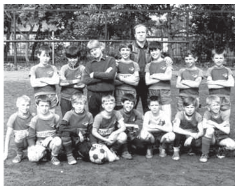
На фото: команда СДЮСШОР 1978 г.р. и ее тренер.