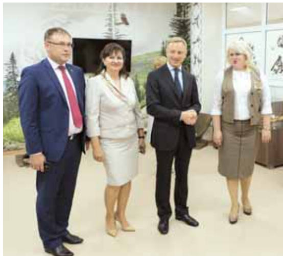
На фото: министр Дмитрий Ливанов (третий слева) посетил Кузбасс впервые. Встреча с кемеровскими педагогами прошла в школе № 78.

А вот высшей школе в Кузбассе есть куда расти. Вузовское образование стало отдельной темой встречи. У нас много талантливых старшеклассников: ежегодно лучшие доходят до финального этапа предметных всероссийских олимпиад, занимаются научными исследованиями, но когда перед ними встает вопрос, где получать профессию,