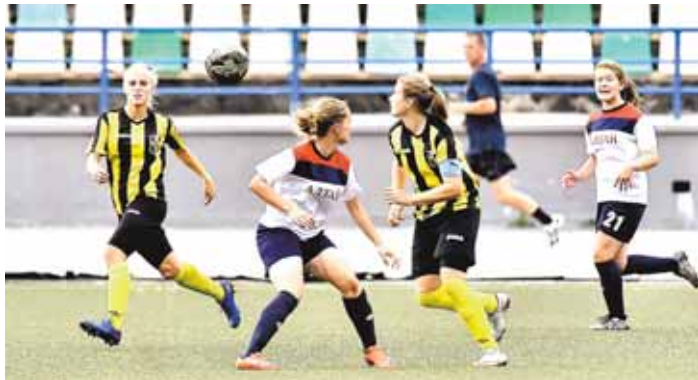
На фото: «Кузбасс» уверенно обошёл «Алтай».

В этот раз на старт вышли 206 спортсменов (95 – в часовом беге) из Кемерова, Кемеровского района, Анжеро-Судженска, Белова и Тайги. К