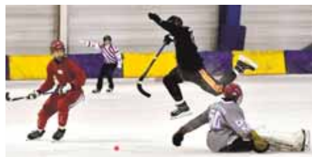
На фото: «Кузбасс» много атаковал.

В ряд ли стоит делать серьёзные выводы из первого матча, так как у «Кузбасса» серьёзные перемены в линии атаки. Да и ход игры не всегда сопровождался логичностью голов. Например,