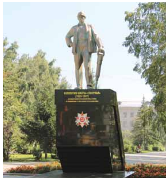
На фото: памятник горнякам шахты «Северная» в Рудничном районе.