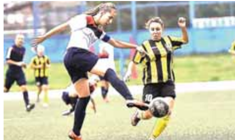
На фото: «Алтай» забил всего лишь раз.

Осознавая, что «Кузбасс» уже был недавно