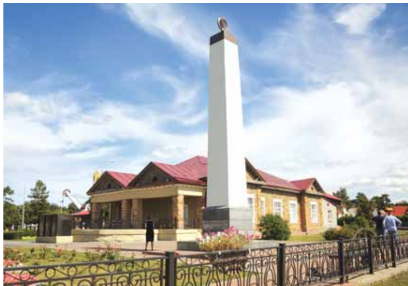
На фото: памятная стела была воздвигнута в честь 50-летия Кемеровского рудника.