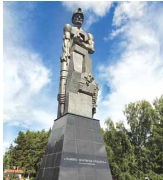
На фото: монумент «Память шахтёрам Кузбасса» работы Э. Неизвестного.

Именно поэтому улица Кузбасская, ещё ранее побывавшая улицей Сталина, получила название Ноградской, а рядом на Весенней открылся ресторан «Шалло». По той же самой причине в самом молодом районе города – Ленинском – в 1979 году началось строительство нового микрорайона с названием Шальготарьян. А поскольку объединяющей идеей была интернациональная дружба двух угольных городов, то и все эти объекты можно считать своеобразными памятниками шахтёрской профессии.