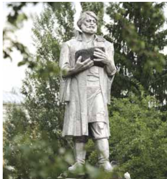
На фото: памятник М. Волкову на одноимённой площади г. Кемерова.

Эрнста Неизвестного... Грянул Государственный гимн России. Затем была исполнена «Рабочая мелодия Кузбасса» – гимн Кемеровской области. Завершил церемонию салют – три залпа воинского подразделения. К пьедесталу монумента хлынули кемеровчане, пришедшие на митинг...»