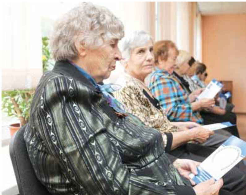
На фото: на встрече пенсионеры получили брошюры, где описаны самые распространённые способы обмана.

Дежурство специалистов на воде по обеспечению безопасности кемеровчан – привычное дело, и, как признают специалисты, очень действенное. Спасенные жизни и предотвращенные трагедии среди детей, находившихся без присмотра взрослых у водоемов, – заслуга специалистов ГО и ЧС. Ежедневное патрулирование акватории продлится до конца навигационного сезона. ☑ По информации пресс-службы управления ГО и ЧС г. Кемерово.