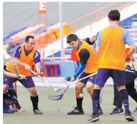
На фото: на прошлогоднем турнире удача сопутствовала дружной украинской команде (оранжевые жилетки), ставшей победительницей.

Ближайшие товарищеские матчи по хоккею с мячом в Кемерове. 9 сентября (пятница). «Кузбасс» – «Байкал-Энергия» (Иркутск) (начало в 12.00). 12 сентября (понедельник). «Сибсельмаш» (Новосибирск) – «Байкал-Энергия» (начало в 17.00). 14 сентября (среда). «Кузбасс» – «Байкал-Энергия» (начало в 12.00).