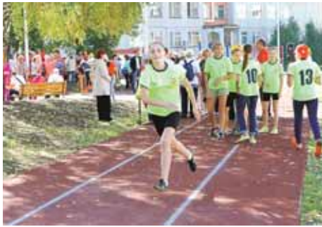
На фото: на беговой дорожке.