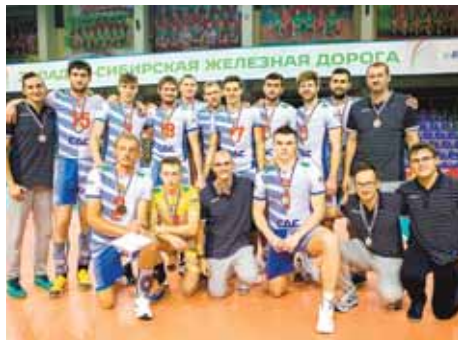
На фото: «Кузбасс» – бронзовый призер Кубка Сибири и Дальнего Востока 2016 года.

– Будем играть, стараться побеждать в каждой встрече, а там... Сложно прогнозировать выступление на Кубке России,