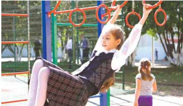
На фото: здесь физкультурой может заниматься каждый.

Всё это спортивное ядро школы № 97, более трети учащихся которой активно занимаются спортом. Можно сказать, школьный стадион нового типа. Насколько на нём удобно, уже опробовали на себе школьники Заводского района. В день открытия здесь состоялись состязания районной спартакиады школьников по волейболу, баскетболу, настольному теннису, лёгкой атлетике и подтягиванию на перекладине. «Дебют»