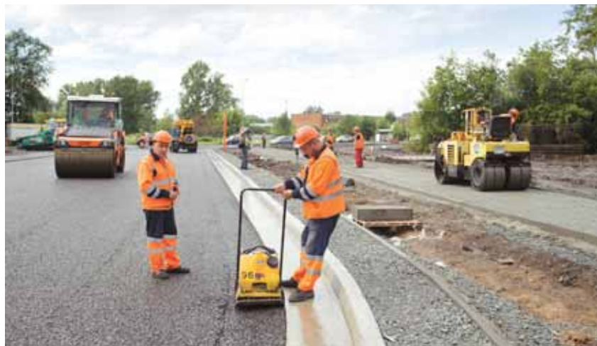
На фото: по заверению городских властей, работы по ремонту дорог будут проводиться в комплексе с благоустройством прилегающей территории.

По информации пресс-службы администрации г. Кемерово.