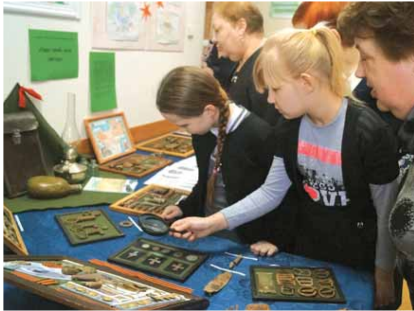
На фото: увлекательная игра в исследователей помогает ребятам глубже познакомиться с событиями 1917 года, многие из которых происходили на территории современного Кузбасса.

Из увлечения крестьянским бытом родился ещё один долго-