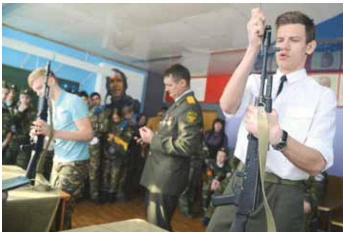
На фото: разборка-сборка АК-74. Счет – на секунды!

По результатам двух дней соревнований победителями конкурса стали юнармейцы из кемеровской школы № 31. Теперь ребята будут готовиться к мероприятиям, посвящённым празднованию Дня Победы и несению Вахты памяти у Вечного огня. Евгения БЛИЗНИКОВА.