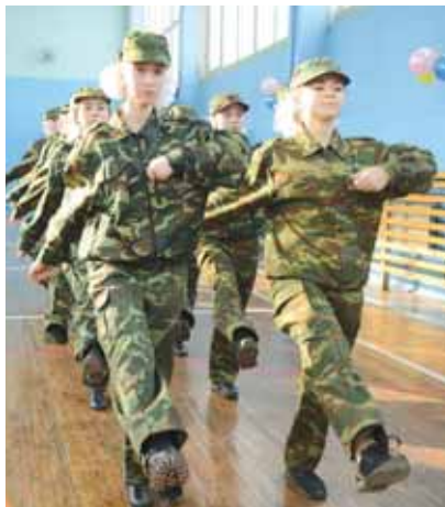
На фото: юнармейский отряд школы № 31.

Сегодня в городе 40 школьных юнармейских отрядов, в составе которых 600 мальчишек и девочек. В ходе районных этапов конкурса были выбраны наиболее подготовленные команды, которым и предстояло побороться за право нести Вахту памяти на Посту № 1 у Вечного огня, а также за возможность присоединиться к городским акциям, посвящённым празднованию Дня Победы. Всего в финал смотра-конкурса попали 20 кемеровских отрядов и отряд юнармейцев школы № 8 города Юрги, также приехавший в областной центр побороться за победу.