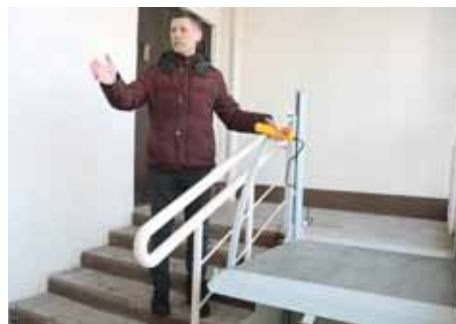
На фото: специальный подъемник позволит инвалидам-колясочникам преодолеть путь от дверей дома до лифта.

Буквально в нескольких шагах – бульвар Строителей. Его прогулочную пешеходную зону городские власти намерены привести в порядок этим летом, в подарок городу к 100-летию. Кроме того, рядом с новостройками в 2016 году был заложен ещё один небольшой сквер – на территории Кемеровского государственного сельскохозяйственного института в рамках соглашения между вузом и застройщиком микрорайона ООО «Проград» разбит агропарк, на аллеях которого появились лавочки, высажены газоны и деревья. Горожане тут вместе отмечают праздники, гуляют с детьми и радуются тому, что им посчастливилось поселиться в таком удобном и красивом месте. К юбилею областной столицы таким приветливым должен стать каждый ее уголок. М Мария ФУРМАНЕНКО.