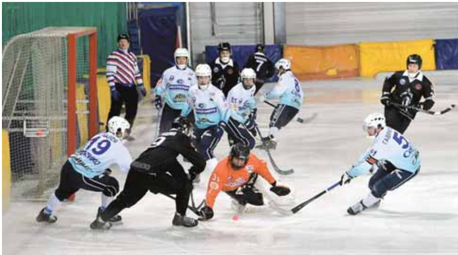
На фото: почти весь матч в Кемерове «Кузбасс» атаковал, но пропустил мячей в... три раза больше, чем забил.