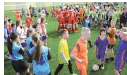
На фото: среди множества команд – участниц сибирского этапа «Мини-футбол – в школу» в красноярской «Арене Енисей» всегда были кемеровские, нынче они и среди победителей.

В ближайших матчах играют: 18 марта (суббота). В Новосибирске: «Реклама Онлайн» – «Перекрёсток Ойл».