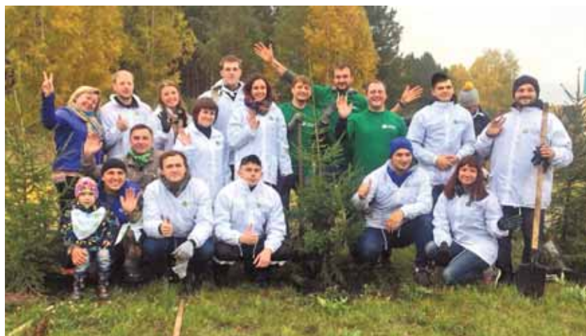
На фото: «Зеленая дружина» фонда «Город 42» на экологической акции.

Человек не был бы человеком без добрых дел, совершаемых бескорыстно. Сделать это можно разными способами: помочь одинокой соседской бабушке, отдать одежду в социальный центр или детский дом, перечислить деньги на счёт благотворительной организации.