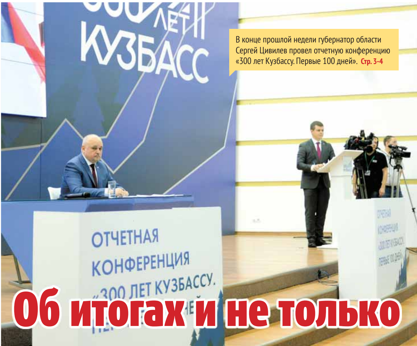
В конце прошлой недели губернатор области Сергей Цивилев провел отчетную конференцию «300 лет Кузбассу. Первые 100 дней». Стр. 3-4