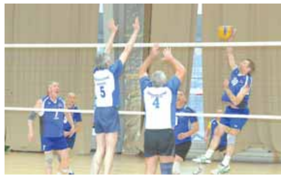
На фото: атакуют заводчане.

Следующий этап спартакиады – бильярд. К Борис ПРОСКУРИН.