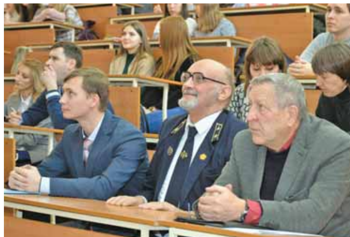
На фото: участники круглого стола.