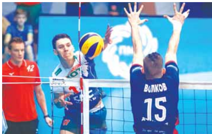
Волейболисты кемеровского «Кузбасса» в труднейшей игре переиграли «Факел» из Нового Уренгоя.

В третьей партии игроки обеих команд демонстрировали надёжную игру в защите. Долгие розыгрыши стали настоящим укра-