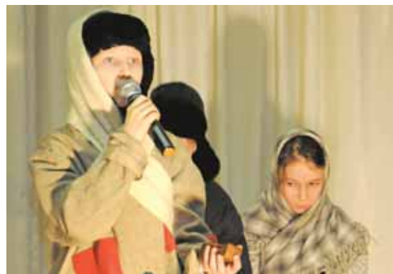
На фото: литературно-музыкальный спектакль о блокаде подготовили ребята из школы № 31.

нит и непроходящее чувство голода, и зиму 41-го, и эвакуацию: – Нас, детей, уже собрали, а потом оказалось, что первая эвакуация не удалась. Ночевали в здании школы. Ночью кто-то крикнул, что школа горит, началась страшная давка. Много детей в ней погибло. Меня вынесли оттуда на плечах... И помню, как потом всё-таки эвакуировались: на машине ехали по Ладожскому озеру. Под колесами была вода. Мы сидели в кузове с бабушкой.