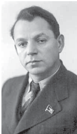
На фото: первый секретарь Кемеровского обкома и горкома ВКП(б) Семён Борисович Задюшонченко.