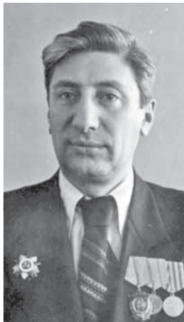
На фото: первый председатель Кемеровского облисполкома Владимир Антонович Гогосов.