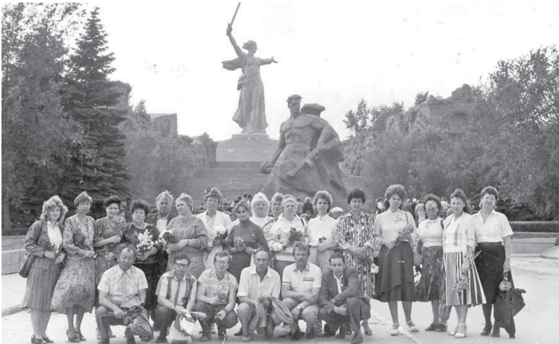
На фото: делегаты всесоюзной акции «Рейс мира» на Мамаевом кургане в городе-герое Волгограде, 1970-е.

бодителя Праги: «Детали войны мы познали потом... Узнали и ее горькую цену, но в те дни мы не имели права ни сомневаться, ни трусить, ни тем более отступить. Уже в первом бою – за одну из высот на подступах к Сталинграду – наша рота потеряла треть личного состава. Положение дел постоянно менялось, ожесточенная борьба велась за каждый метр земли, но советские солдаты в результате оказались сильнее».