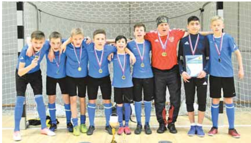
На фото: команда «Заря» детского дома № 2 города Кемерово, старший состав.