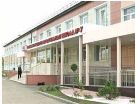
На фото: в 2019 году школа № 7 открылась после масштабной реконструкции.