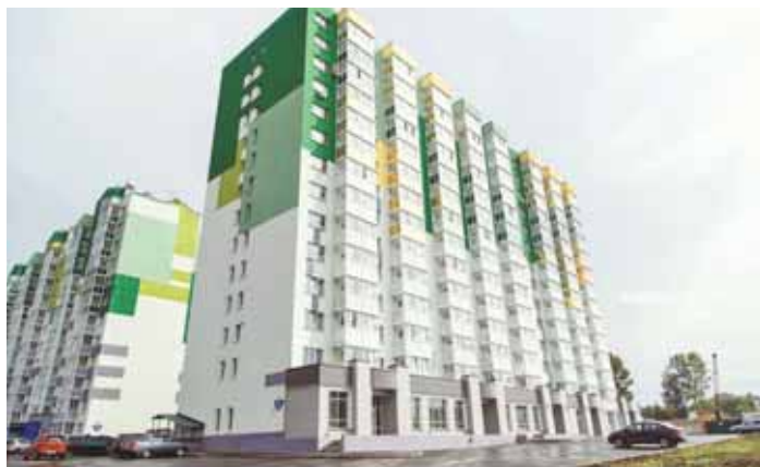
На фото: за последние пять лет в районе было построено 17 многоквартирных домов.

Большое внимание в районе уделяют благоустройству общественных пространств – парков, скверов, прогулочных зон. В 2019 году был открыт уникальный для Сибири городской ландшафтный