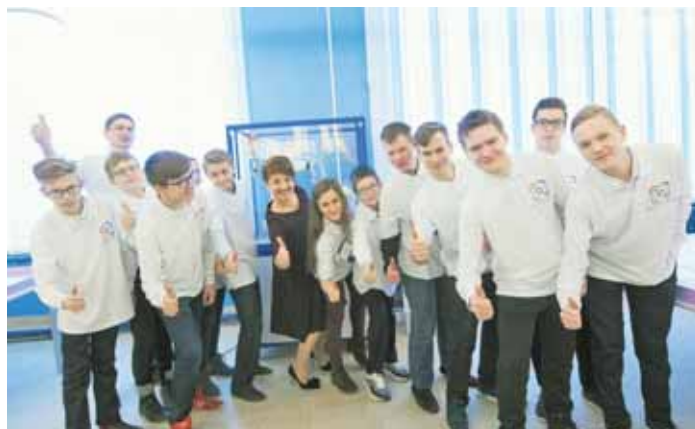
На фото: в декабре 2018 года в Заводском районе открыт первый в Кузбассе «Кванториум 42».