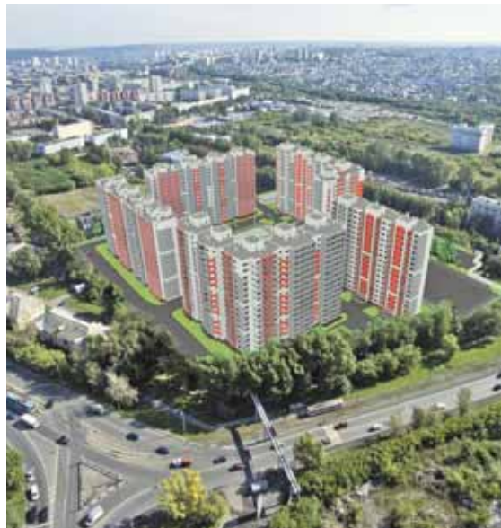
На фото: макет строящегося жилого комплекса «Кузнецкий».

Район неуклонно меняется к лучшему в том числе благодаря созидательной энергии жителей. Активисты совместно с теруправлением приводят в порядок свои дворы и общественные пространства, участвуют в конкурсах по благоустройству и плановых субботниках. Каждую весну в рамках акции «Нас всех объединяет красота» высаживают молодые деревья и кустарники. В 2019 году заводчане с энтузиазмом включились в акцию «Юбилей района – 75 добрых дел». Украшают парки и скверы арт-объектами. Так, в сквере Ново-рожденных появились компози-