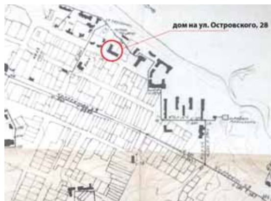
На фото: фрагмент плана застройки притомского участка и кварталов Соцгорода.