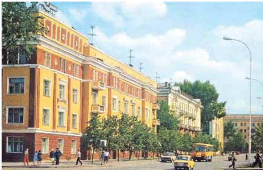
На фото: открытка из набора «Кемерово. 1989 год».