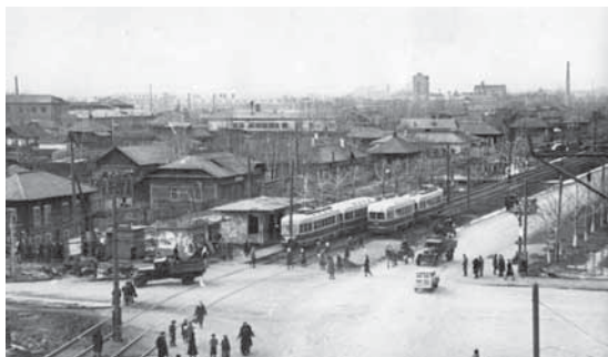
На фото: улица Кирова.

Левый, пологий берег Томи имеет удобный доступ к воде, этим и объясняется строительство коксохимического завода именно здесь – технология производства кокса водозатратна. На высоком правом берегу расположены угледобывающие шахты. Отсюда и транспортировался уголь по канатной дороге на коксохимзавод напротив.