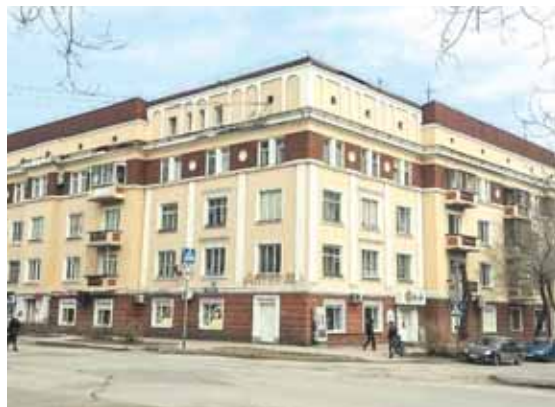
На фото: дом-близнец на улице Рукавишников, 14.