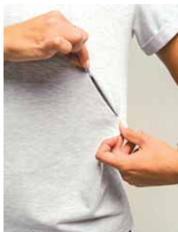
На фото: фирменная футболка с замком «молнией».

– Все декретные деньги я и потратила на открытие своего бизнеса. Оказалось, что не стоит бояться что-то начинать. Когда есть огромное желание, то средства найдутся. И с 50 000 рублей можно начать раскручивать дело. Только нужно понимать, что в этом случае рост будет очень медленный, – уверена бизнесвумен. – Я смогла это сделать даже без специальных знаний. Очень помогло общение с дру-