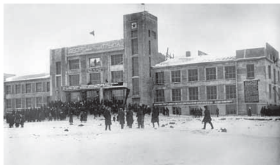
На фото: нынешний адрес Дворца труда – улица Карболитовская, 11.