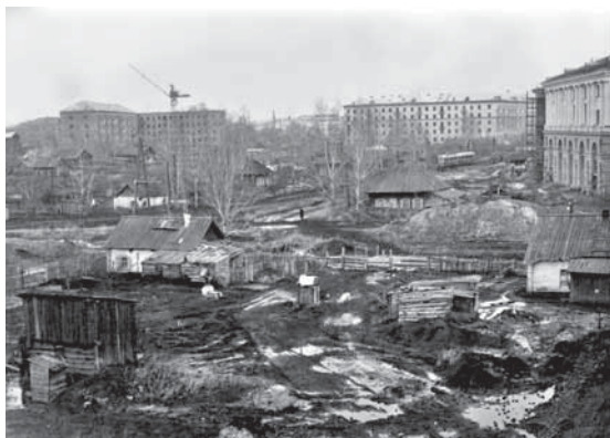
На фото: площадь Волкова, 1957 год.

Один из жилкомбинатов в центре города построили. Это четыре четырехэтажных здания на притомском участке с клубом (сегодня Театр для детей и молодежи) и столовой (сгоревшим рестораном «Сибирь»). Правда, за время строительства жилые помещения в этих домах утратили задуманное социальное равенство. В каждом из них располагалось жилье коридорного типа, двухкомнатные квартиры с санузлами на лестничных клетках для семей ИТР и большие комфортабельные квартиры с ванной и туалетом – для начальства.