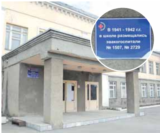
На фото: школа № 8, ул. Коммунистическая, 14.

«Москва», агитбригада из выздоравливающих красноармейцев.