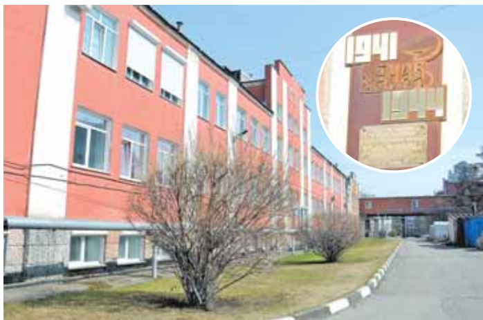
На фото: один из корпусов областной больницы скорой медицинской помощи, ул. Островского, 22.