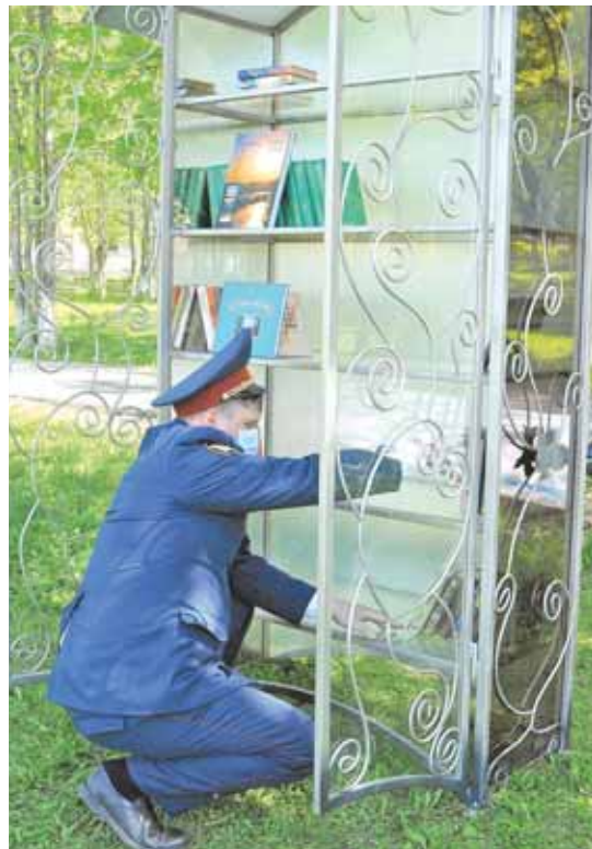
На фото: сотрудники ИК-43 уверены, что новый шкаф для буккроссинга будет востребован среди жителей посёлка Ягуновский.