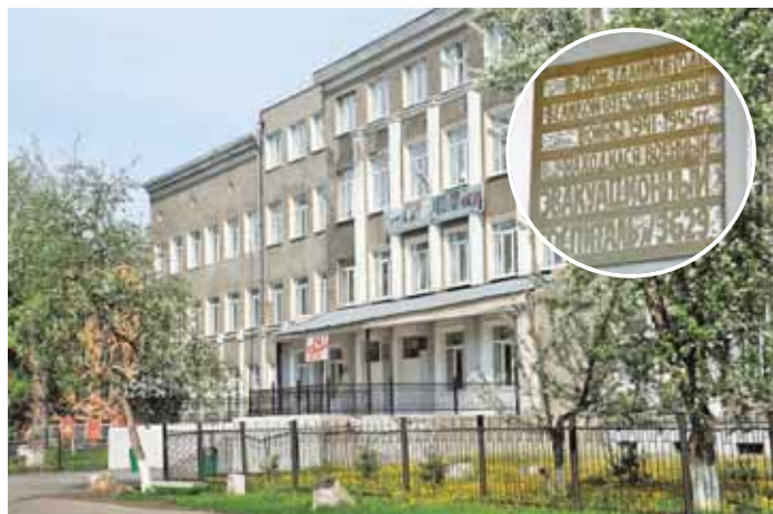
На фото: средняя школа № 19, ул. Назарова, 8.