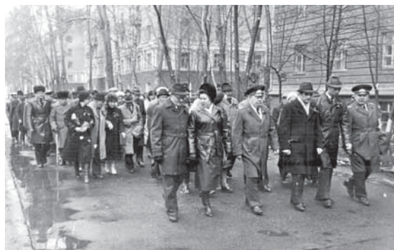
На фото: встреча ветеранов легендарного Нежинско-Кузбасского корпуса в Кемерове и закладка аллеи Памяти, 1980 г.