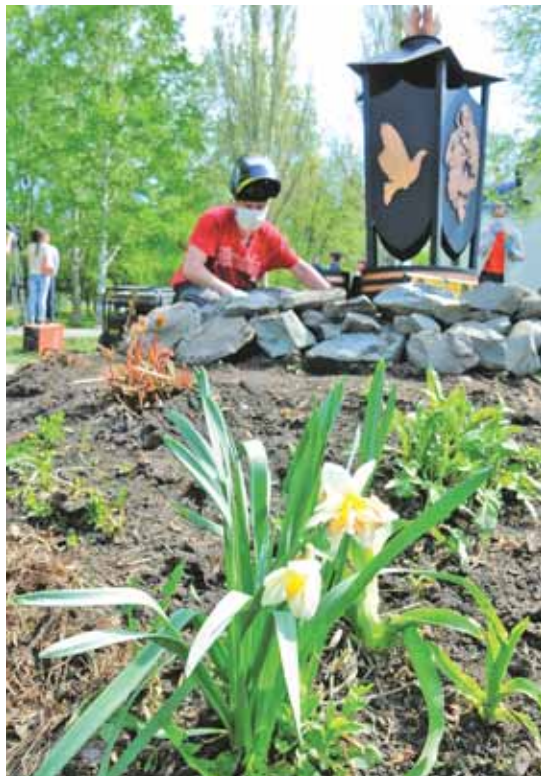
На фото: обелиск в память о подвиге советского народа в Великой Отечественной войне установлен по инициативе активистов ТОС.