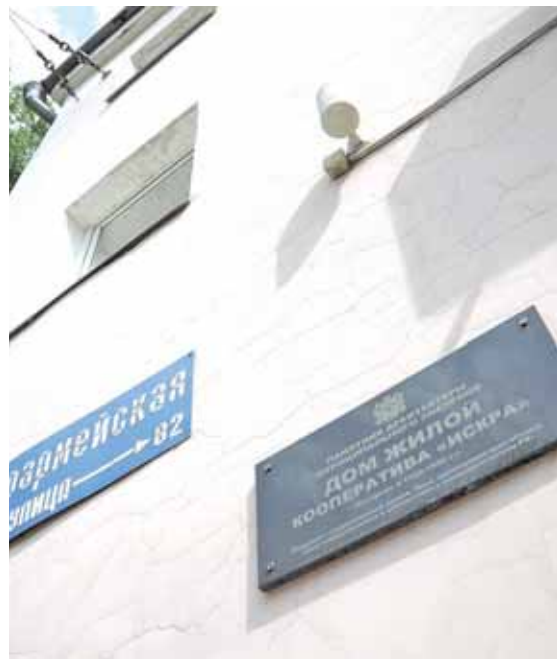
На фото: дома кооператива «Искра» являются памятниками архитектуры и градостроительства местного значения.

– Здания двухсекционные, симметричные в плане, с двумя