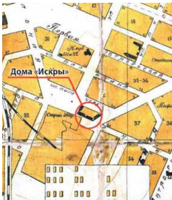
На фото: фрагмент плана г. Кемерово 1932-34 гг. с разбивкой улиц по первому генплану 1918 года (проект инженера П.А. Парамонова). В центре – четыре каменных дома кооператива «Искра».

На волне новой экономической политики в советском