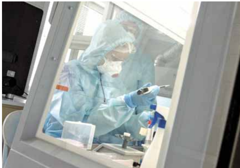
На фото: сейчас в Кузбассе проводится около 3900 тестов в сутки на коронавирусную инфекцию нового типа.

– Нашим детям выпало жить в непростых условиях. Дистанционный режим – нелегкое испытание и для школьников, и для педагогов и родителей. Но мы справились. И даже если выпускные вечера не пройдут в обычном формате, мы обязательно проведем их позже. Я надеюсь, 1 сентября школы откроются. Сейчас делаем много капитальных ремонтов, строим новые школы, спортивные площадки, закупаем дополнительное цифровое оборудование. Школьники непременно увидят