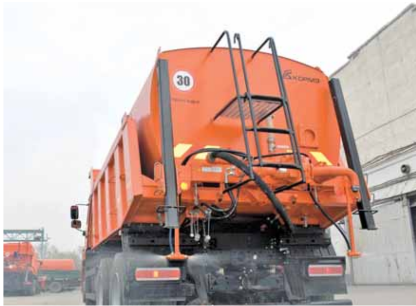
На фото: многофункциональная машина для дезинфекции улиц, разработанная на кемеровском заводе КОРМЗ.

– Ровно в 10 утра в день 300-летнего юбилея города тяжелая техника пойдет по объездной дороге. Грузовики больше не станут разрушать дорожное полотно мариинских улиц. Также мы в этом году выделяем значительные средства на ремонт городских дорог, разбитых большегрузами. В стадии строительства еще один проект на этой же