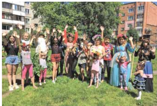
На фото: мероприятие ЦРН «Меридиан».