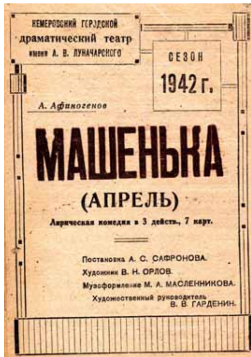
На фото: афиши Кемеровского городского драматического театра в годы войны.

«Московский театр оперетты, направленный в силу обстоятельств военного времени для художественного обслуживания Кузбасса, за период своего пребывания в гор. Сталинске и Прокопьевске показал 14 лучших произведений опереточного искусства и дал более 600 спектаклей... В общественном порядке театром было дано более 500 шефских концертов.