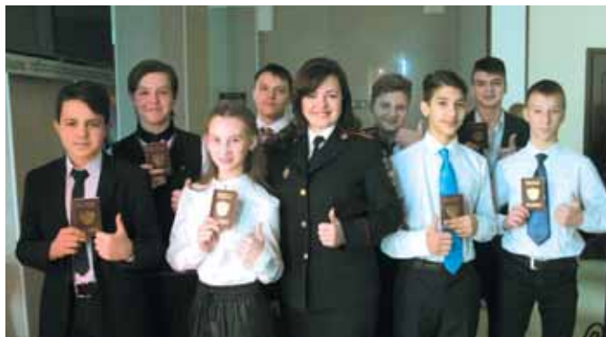
На фото: добрая традиция – торжественное вручение паспорта гражданина РФ юным кемеровчанам.

Паспорт гражданина Российской Федерации является основным документом, удостоверяющим личность каждого. Паспорт гражданина РФ обязаны иметь все граждане России, достигшие 14-летнего возраста и проживающие на территории нашей страны.