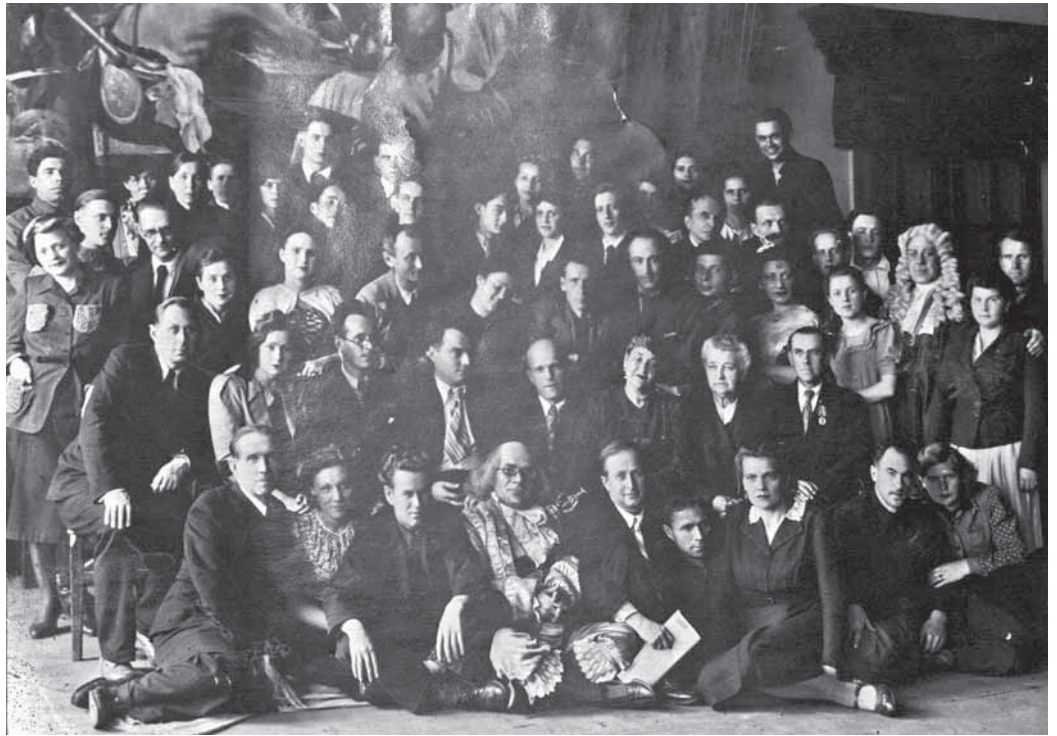
На фото: труппа Кемеровского городского драматического театра, 1945 год.

Есть немало цитат о том, насколько несовместимы понятия войны и культуры. Но надо признать: в самые непростые годы для нашей страны, когда её народу, отказывая себе во всём, приходилось давать отпор врагам, культура не умерла. Более того, она не только не сдалась обстоятельствам, не только выжила в неимоверных условиях, но продолжала развиваться, питая своей энергией и верой в добро многих и многих людей. Наш сегодняшний материал — о маленьком островке культуры в большом тыловом регионе воюющей страны — в Кузбассе.