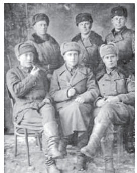
На фото: разведчики 303-й дивизии.

В Новосибирской области в начале войны была также образована – в составе 6-го Сибирского добровольческого корпуса – 22-я стрелковая добровольческая дивизия (первоначально