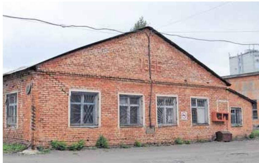
На фото: на ряде старых зданий год постройки выложен на фасаде.

История живет и там, где завода уже нет, – с этого началась эта статья. В нулевые здесь планировалась жилищная застройка и возведение архитектурно продуманного комплекса зданий – правда, пока проекты, участвовавшие в конкурсе, остались на бумаге. Но территория в центре города остается местом силы, местом притяжения горожан, и не возникает сомнения в том, что ее ждет будущее – не менее интересное, чем прошлое. ✎ Лора НИКИТИНА.