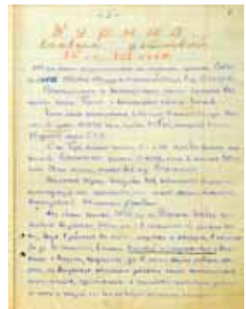
На фото: журнал боевых действий.

вой Верхнеднепровской Краснознаменной дивизии сибиряков-гвардейцев.