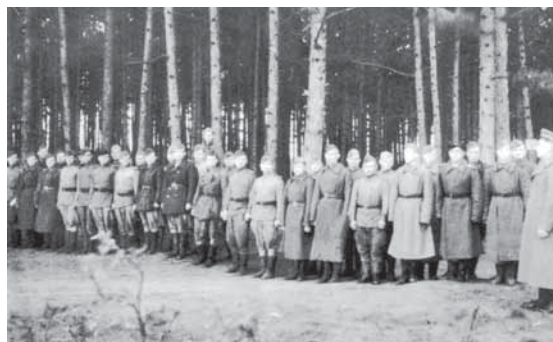
На фото: бойцы 376-й стрелковой дивизии.