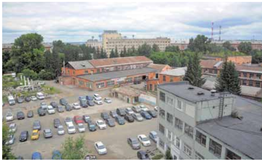
На фото: когда-то весь этот комплекс строений принадлежал электротехническому заводу.

...Началась Первая мировая – завод Посселя выполняет оборонные заказы. Русской кавалерии нужны подковы, подковные гвозди, винтовые шпильки, кованные инструменты. Правда, в 1915-м из-за нехватки материалов предприятие не справляется с военным заказом, и завод конфискует государство. Армия