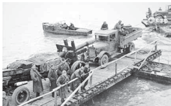
На фото: переправа в Прибалтике, 1944 год.

ся к операции по освобождению Пскова. Здесь дивизии присвоили второе почетное наименование – Псковская. В память о героях одна из улиц этого города названа именем Кузбасской дивизии. В сентябре 1944 года дивизия была награждена орденом Красного Знамени за освобождение Риги. Далее, до самой Победы 1945 года, наши солдаты вели бои в Латвии с Курляндской группировкой противника.