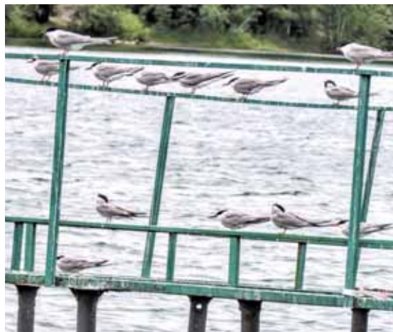
На фото: речные крачки.

Не первый год местные фотографы хвастаются кадрами с речными крачками. Вот у Екатерины Комаровой на снимке целое