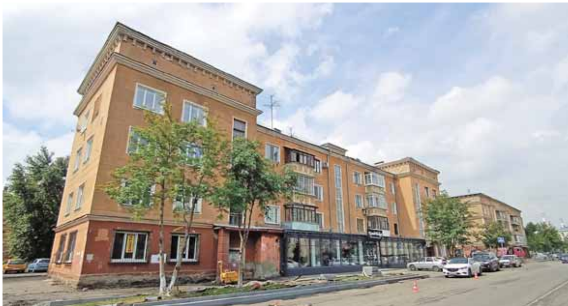
На фото: дом № 3 на улице Чернышевского – архитектурный близнец нашего героя.

хитекторами в проектно бюро Кемеровокомбинатстрой.