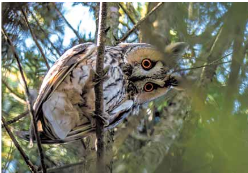
На фото: ушастая сова.