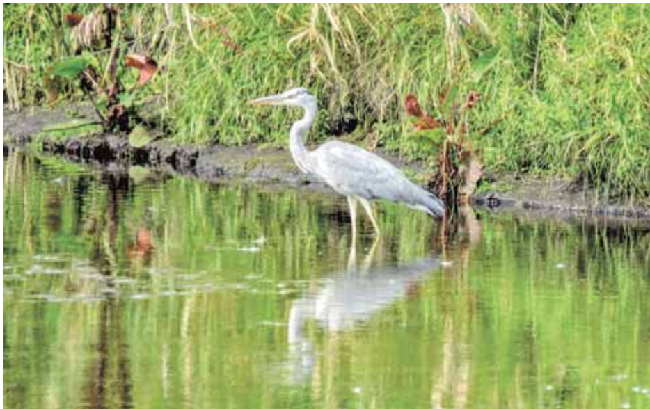
На фото: серая цапля.

Наш славный уютный Кемерово ведет двойную жизнь! С одной стороны – он молодой, прогрессивный, растущий ввысь и вширь мегаполис, где эпоху кирпичика и камня уже почти сменила эра монолита. С другой – он живой, с зарослями необузданной дикой зелени, деревьями-исполинами, полями благоухающего разнотравья, настоящими рощами и борами.