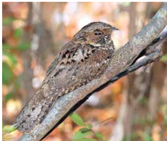
На фото: козодой.

Есть в Кемерове и сапсаны-старожилы. Высотное строительство соколам на руку. Они любят селиться в местах повыше, с хорошим обзором и малой доступностью для посторонних.