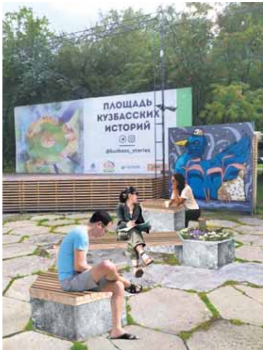
На фото: проект лавочек, «вырастающих» прямо из плитки.

В этом году все ждали не менее насыщенной программы, но запрет на массовые мероприятия внёс свои коррективы. Площадка пустовала и производила