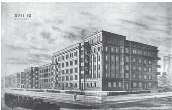
На фото: эскиз дома на ул. Севастопольской, 5, 1930-е годы.