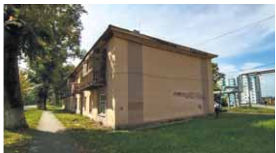
На фото: за «спинами» старых барачков возвышаются новенькие многоэтажки.

Важным для микрорайона Антипова будет и следующий год. На территории планируется строительство школы – большого современного образовательного комплекса на 825 учащихся (300 ребятишек смогут посещать начальную школу, а 525 будет учиться в основном здании). Необходимость давно назрела – причем об открытии здесь школы мечтают не только