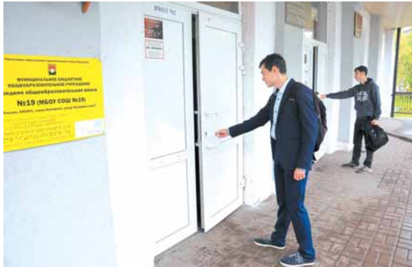
На фото: вот так, через разные входы, будет организован приём детей на занятия в школах города.