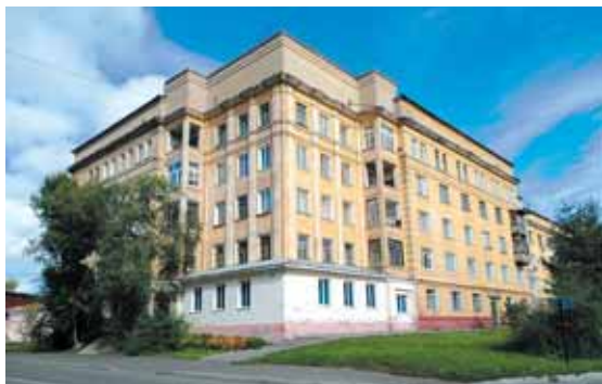
На фото: дом на ул. Севастопольской, 1, – зеркальное отражение дома № 5.