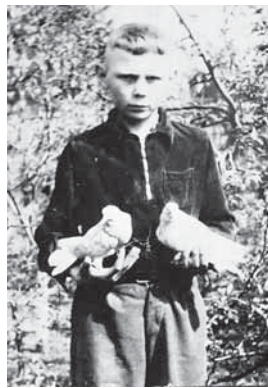
На фото: детское увлечение супруга превратилось в хобби семейное.

– Поступил в горный техникум, а там нужна специальность горняцкая. Рассчитался и ушел на шахту, – рассказывает он. – Много кем довелось поработать. Пока учился, был пропитчиком – в массив воду качали, чтобы при взрывных работах было меньше угольной пыли. Бурмашинистом был, механиком. Зато после техникума сразу дали хороший разряд, четвёртый. До выхода на заслуженный