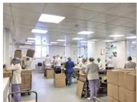
На фото: Кемеровская фармацевтическая фабрика оперативно наладила выпуск дезинфицирующих средств.