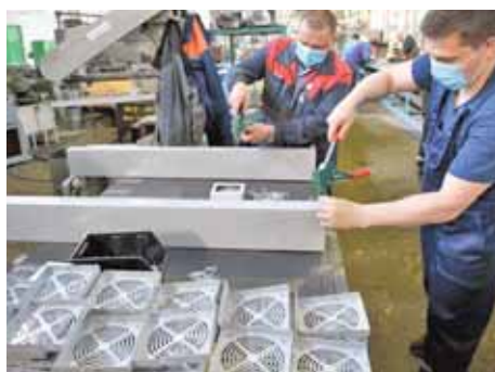
На фото: производство ультрафиолетовых рециркуляторов на Кемеровском механическом заводе.

На сегодня в городе осуществляют свою деятельность 30 крупных и средних промышленных предприятий, более 950 предприятий-производителей малого бизнеса пищевой, химической промышленности, машиностроения и других отраслей.