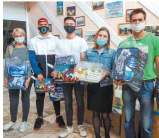
На фото: молодые специалисты ПАО «Кокс» передали подарки кемеровскому детскому дому № 2.

Собрать ребёнка в школу – непростая задача для многих семей. Ежегодно в преддверии Дня знаний решить её помогает Промышленно-металлургический холдинг.