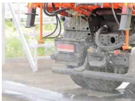
На фото: специальные насадки, разработанные инженерами КОРМЗ, позволяют дезинфицировать большие площади.