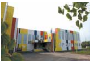
1 сентября занятия начались в новом корпусе школы № 85 в Кемерово.

Стоимость строительства – 100 млн рублей, на оборудование и оснащение клиники направлено еще 31 млн рублей. Источник финансирования – бюджет области.