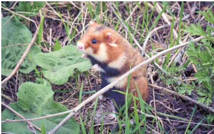
На фото: хомяк рыжий с отвратительным характером.

Сейчас свои летние рыжие шубки большинство наших белочек уже поменяло на теплые морозостойкие. А к первому серьезному снежку все будут как одна – серебристо-серо-пепельные. Зимний наряд им к лицу!