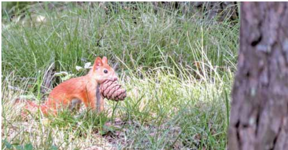
На фото: белка с добычей.

У наших пушистых когтистых соседей по мегаполису осенью всё те же дела, что и у нас, – подготовка к зиме. Её дикие зверьки проведут по-разному. Одни залягут в свои глубокие уютные норы до весны. А другие переоденутся в тёпленькие шубки и останутся переживать холода вместе с нами: будут отыскивать припрятанные с осени в дуплах и листве орешки, охотиться, откапывать жухлую траву и корешки из-под снега. Наведаются за гостинцами и к людям.