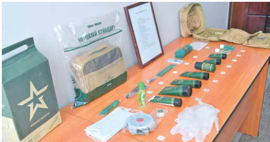
На фото: с этого года в дорожный набор призывника включены средства индивидуальной защиты.

Продолжением реновации этих зон отдыха стал ремонт пешеходного тротуара по четной стороне пр. Ленина от ул. Соборной до Центрального проезда по нацпроекту «Безопасные и качественные автомобильные дороги». Тротуар объединил 4 мини-сквера и сделал зоны отдыха доступнее для кемеровчан. ☑