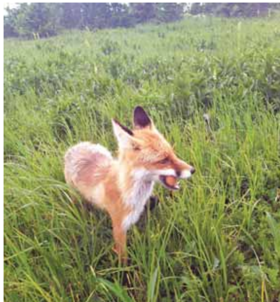
На фото: плутовка лиса.

На самом деле абсолютно все представители куньих, которые водятся в Сибири и в Кузбассе,