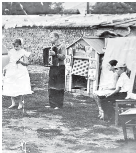
На фото: в 1950–60-е годы во дворе собирались ребятишки со всей округи.