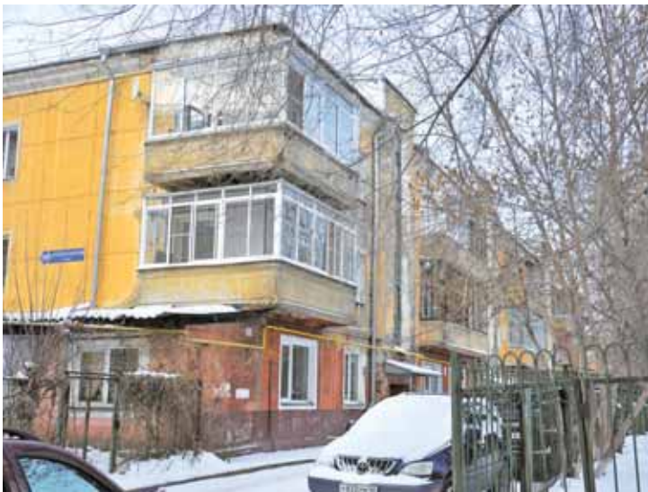
На фото: ныне здесь закрытый уютный дворик.

ся в этом квартале единственным высотным – массовое строительство пятиэтажек здесь начнется только в конце 1950-х – начале 1960-х годов.