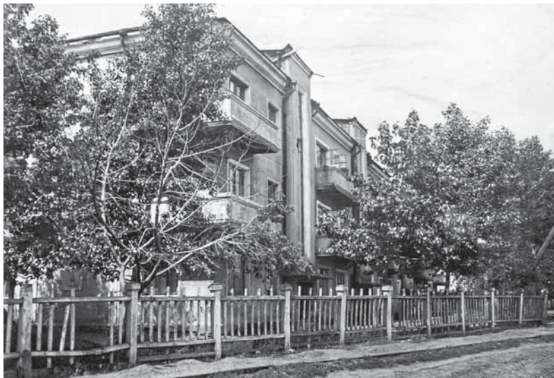
На фото: в 1947 году мимо дома шла улица Пролетарская.

Этот дом затаился в дебрях центра Кемерова с его сталинками и хрущевками так хорошо, что без надобности рядом с ним так запросто и не окажешься. С одной стороны его скрывают пятиэтажки по улицам Красноармейской и 50 лет Октября, с другой – длинная лента гаражей у завода «ЗЭТА», которая вдруг прерывается скромной тропинкой. Та бежит меж кирпичных стоек-невеличек с навесными замками, пока не упирается в массивное здание с балконами по углам, от которого веет доброй, уютной стариной.