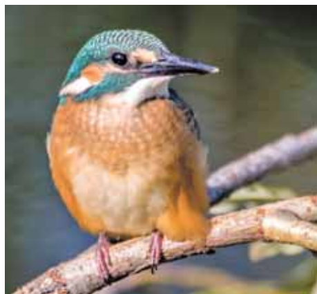
Зимородок на Красном озере.