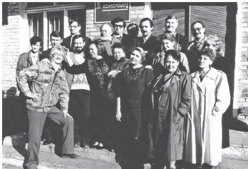
Коллектив газеты «Кемерово» в 90-е годы на фоне здания редакции на Чернышевского, 2.

Мы продолжаем новую рубрику об истории нашего издания и стодневный обратный отсчет – в феврале 2021 года газета «Кемерово» отметит своё 30-летие. Сегодня листаем старые пожелтевшие подшивки за 1993-94 год и удивляемся, как много изменилось в тематике газеты и жизни города и как много осталось прежним.