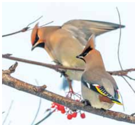
Свиристель на бульваре Строителей.