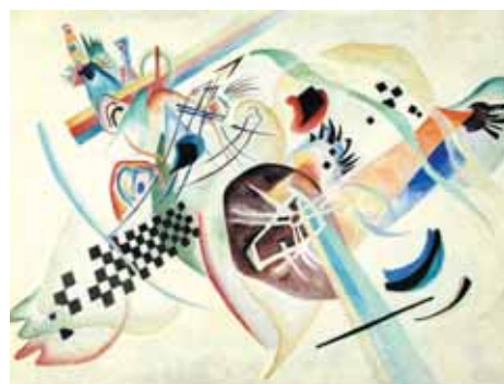
На фото: Василий Кандинский «На белом» (Композиция 224). 1920.

15 декабря в Кузбасском центре искусств открывается мультимедийная выставка «Русский авангард», организованная в рамках деятельности филиала Русского музея в городе Кемерово.