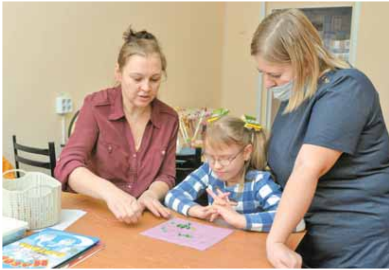
На фото: реабилитация проходит с использованием игровых методик.

Для родителей это надежда, для детей – интересные занятия и весёлые игры. Каждая реабилитационная программа рассчитана на 19 дней. Всего за три недели у многих ребят наблюдается настоящий прорыв в развитии и улучшение многих функций.