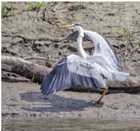
Серая цапля на Искитимке.