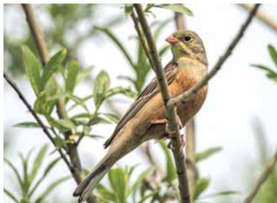
Садовая овсянка.