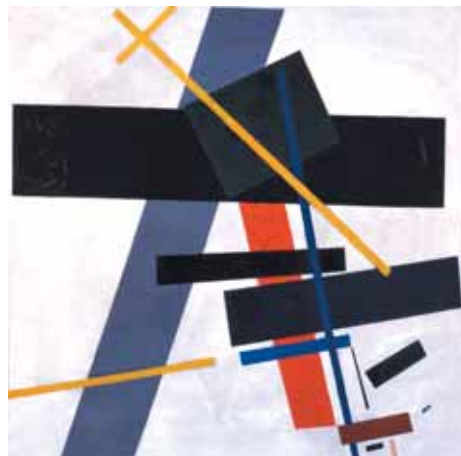
На фото: К.С. Малевич «Супрематизм». 1915-1916.