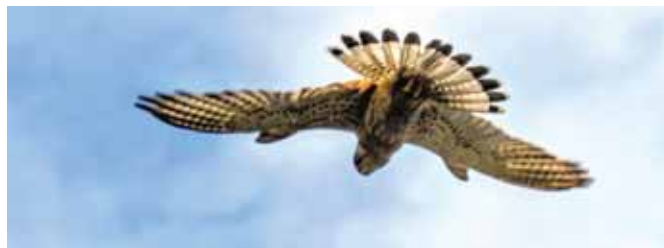
Серебристый лунь.

Бёрдвотчинг (с английского – наблюдение за птицами) – так называется необычное хобби энтузиастов, благодаря которым мы с вами можем рассмотреть пернатых, в том числе и весьма редких. В деталях. От клюва до кончика хвоста. Свои снимки наши герои выкладывают в Интернет – ведут свои блоги, посвящённые птицам, и делятся удивительными находками. Обязательно найдите их в Сети – и погружайтесь в мир живой природы.