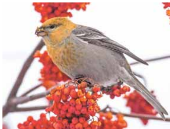
Самка шуры на бульваре Строителей.