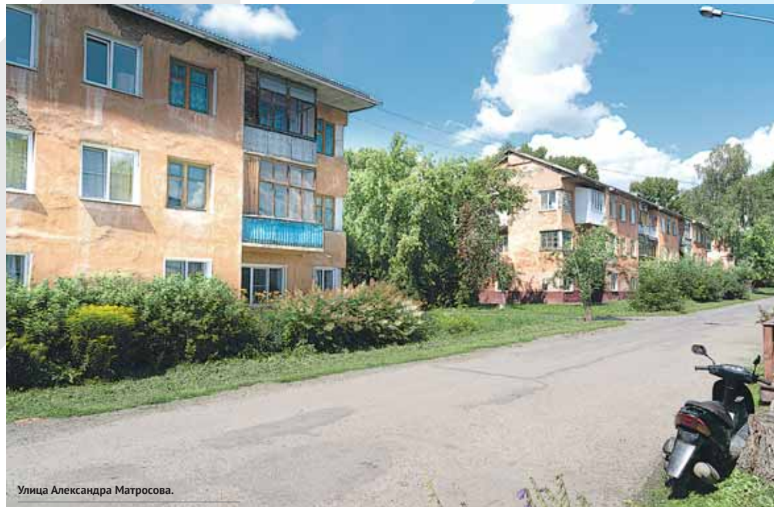
Улица Александра Матросова.

Строили не наобум, конечно. Первоначальный проект капитального поселка, который возводили восточнее промышленного объекта (территория нынешнего старого центра Кировского района), разработал генеральный проектировщик комбината № 392 Гипроспецхим. Планы у московских специалистов были