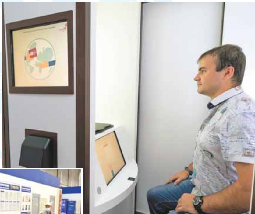
Криптобиокабина работает в МФЦ на Пионерском бульваре, 3.

Специальные накопители принимают пластиковые бутылки емкостью до 2,5 литра и алюминиевые банки, считывая штрих-код. Взамен сданной тары на карту лояльности сети гипермаркетов Лента начисляются бонусные баллы, которые впоследствии можно списать в любом магазине торговой сети.