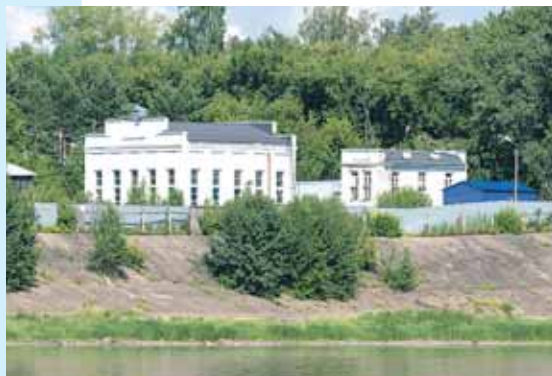
Эстетичное здание кировского водозабора в июле 2021-го...