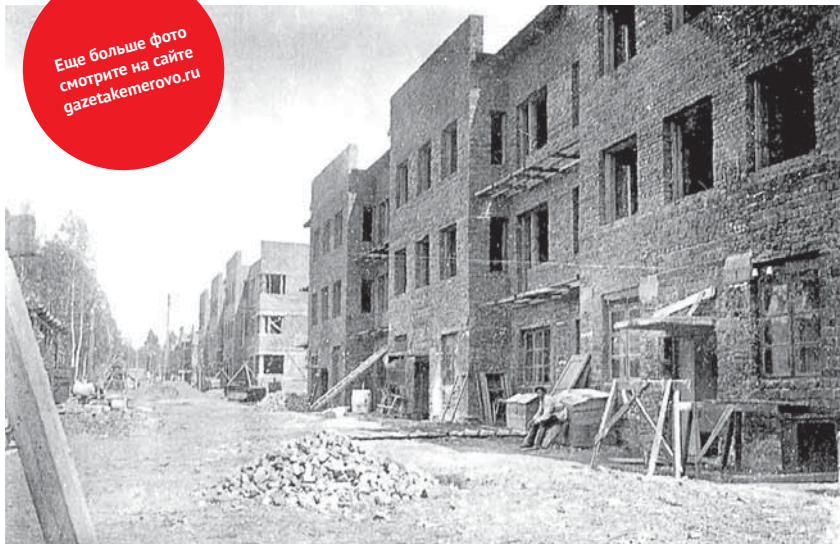
Строительство первых трехэтажных каменных домов в Кировском районе, 1934 год.

Еще больше фото смотрите на сайте gazetakemerovo.ru