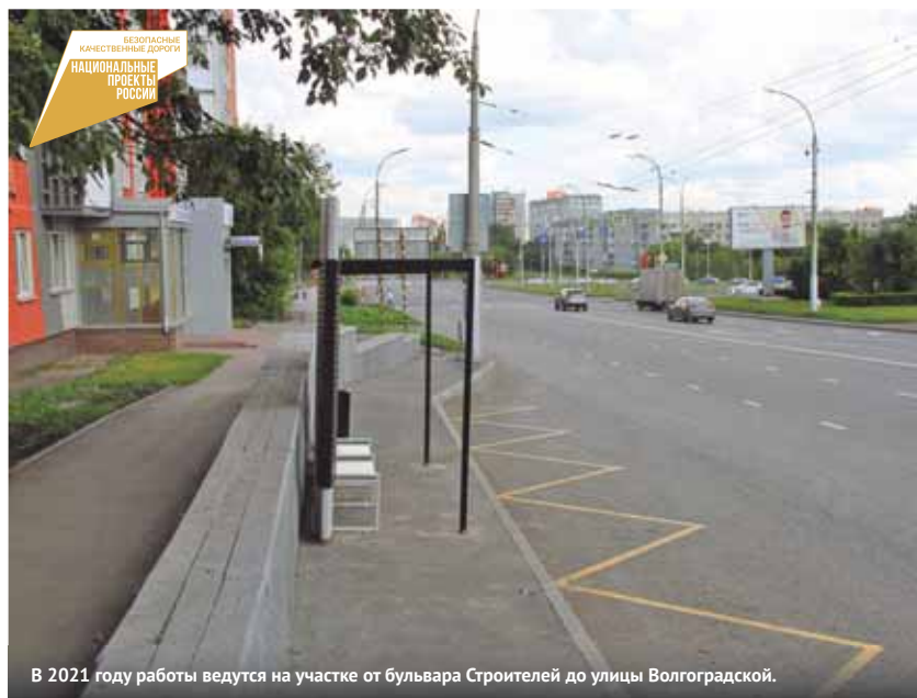
В 2021 году работы ведутся на участке от бульвара Строителей до улицы Волгоградской.

ремонт фасадов 11 жилых домов на пр. Химиков, ул. Ворошилова и б-ре Строителей, идёт обновление дворовых территорий по нацпроекту «Жильё и городская среда».