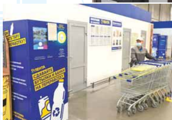
Фандоматы по приему вторсырья установили в двух кемеровских гипермаркетах по адресам: пр. Кузнецкий, 33 и пр. Ленинградский, 28«в».

И это далеко не полный список! Услуг, доступных в цифровом виде, становится всё больше. С их полным перечнем можно ознакомиться на портале gosuslugi.ru.