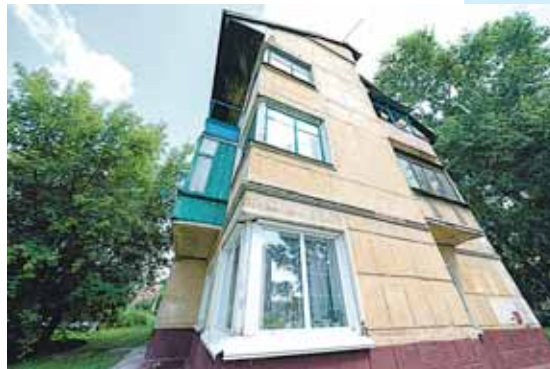
Типичный конструктивистский элемент – угловые окна встык.

Необычно эти дома (особенно на фоне засыпушек и простенького деревянного и фибролитового жилья) смотрелись и внешне со своей смещенной геометрией, витражными подъездными окнами, балконами между секциями, отдаленно напоминающими современные лоджии и другой проект – дома ТЭЦ на левом берегу, «висячими» окнами встык по углам зданий. Последний элемент – вообще отдельная изюминка, которую архитекторы-конструктивисты частично использовали в зданиях масштабных, административных или ведомственных. Нужен он для большей инсоляции помещений. Таков главный принцип конструктивизма: функционал и полезность – на первом месте.