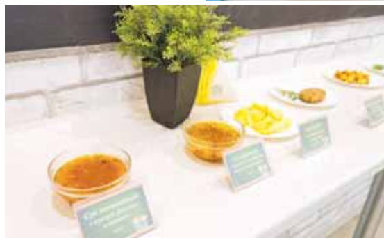
Более 10 новинок осеннего меню представили специалисты МАУ «Школьное питание».

– Например, в этом году появится котлета с тыквой. Дети не всегда приветствуют тыкву,