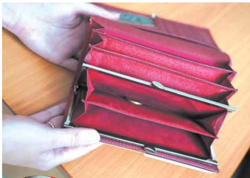
Когда долги становятся непосильными, поможет процедура банкротства.