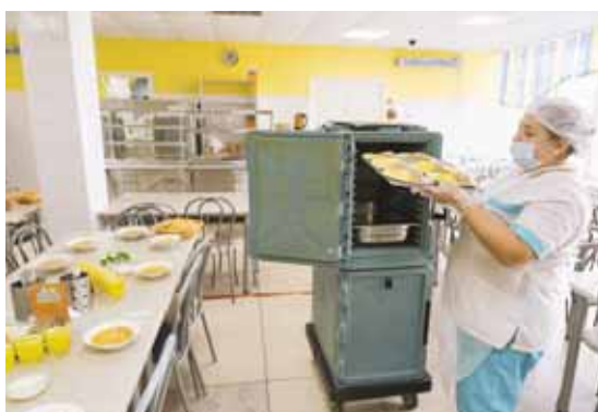
В каждом варианте сезонного меню – более 200 наименований блюд.

Качество сырья, готовых блюд, соблюдение всех технологических процессов – постулаты в школьном питании. Сегодня налажена эффективная обратная связь с родителями. Цифровизация школьного питания позволяет родителям отслеживать питание ребенка в режиме онлайн. В рамках региональной программы «Родительский контроль» обращения, предложения можно оставить в электронном журнале благодаря функции «Ревизор», через мобильное приложение «Школьное питание», на официальном сайте учреждения или странице в социальных сетях. Кроме того, в любое время родители могут лично проверить разные параметры – от соответствия заявленного меню фактическому, выхода блюд, до гигиены в обеденном зале. Специально для этого в МАУ «Школьное питание» разработали чек-листы.