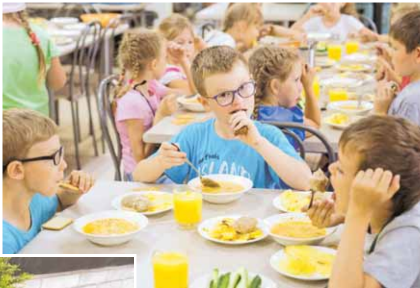
1 сентября новые блюда попробуют более 60 тысяч кемеровских школьников.

Среди новинок этого сезона – фриттата, итальянский омлет с фаршем из куриного филе, свежим томатом, сыром, курица с томатами, перцем, кабачками, а также салат из морской капусты – последний предложили включить дети и родители. Кроме того, появились два новых супа, две новых котлеты, ещё три напитка и несколько наименований выпечки.