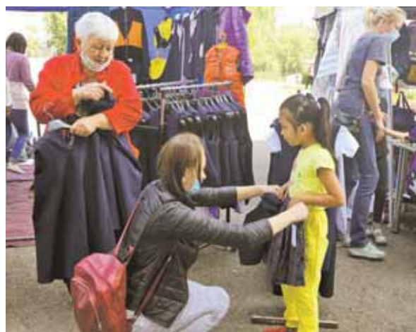
Областная акция «Первое сентября – каждому школьнику» проводится уже более двадцати лет.