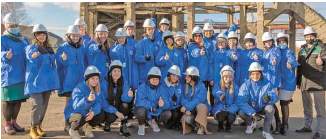
Экскурсия по площадке понравилась гостям.