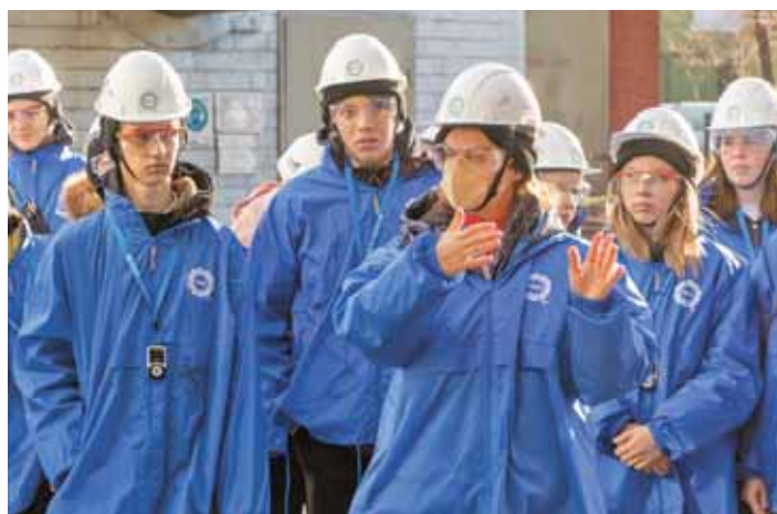
Анна Цивилева поддержала акцию «Неделя без турникетов».