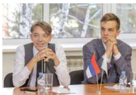
Школьники ответили на вопросы викторины о заводе.

Своим мнением о значимости профориентационной работы в регионе поделилась председатель