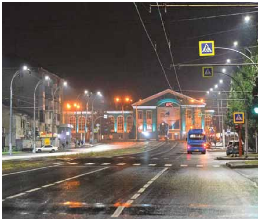
На этом снимке видны и устаревшие лампы с желтым светом, и обновлённое освещение – на переднем плане.

Модернизация системы уличного освещения в городе Кемерово – тема крайне актуальная. Качественное освещение – это безопасность всех участников дорожного движения, комфорт горожан, профилактика преступности, травматизма, аварийности, улучшение социального климата, повышение туристической привлекательности города.