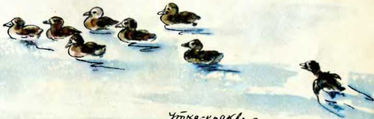
Утка-кряква с утятами