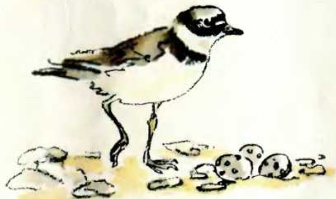
Кулик-галстучник у гнезда

птиц, которые несутся прямо на земле и прикрывать свои яйца не умеют. Ни за что не уцелеть бы им, если б у этих птиц яйца не были такого же цвета, как земля, на которой они лежат. Трудно заметить жёлтые с пятнами яйца куличка-галстучника, когда они лежат в ямке на жёлтом песке среди разноцветных камешков — гальки. Выходит, не случайно так по-разному окрашены яйца разных птиц.