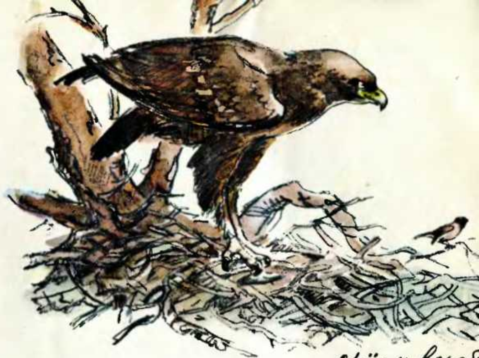
орёл и воробей

Недаром и воробей, бывает, совьёт себе гнёздышко в огромном гнезде орла. Орёл на такого малыша и внимания не обращает: воробей для него не добыча. А попробуй-ка хоть кошка сунься к воробьиному гнёздышку! Придётся ей дело иметь с орлом. А с ним кошке не тягаться: мигом разорвёт.