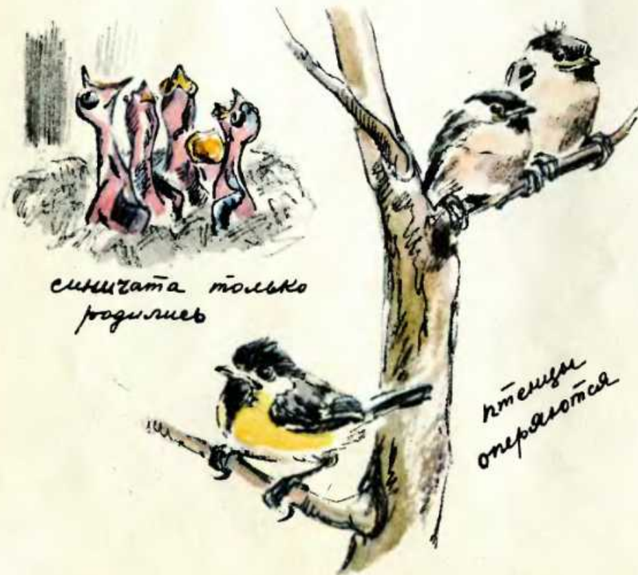
Синеватые только родились

Но скоро у птенцов на тельце вырастет пух, и им уже теплее. Потом у них под кожей темнеет: там начинают расти синеватые трубочки — стволья перьев.