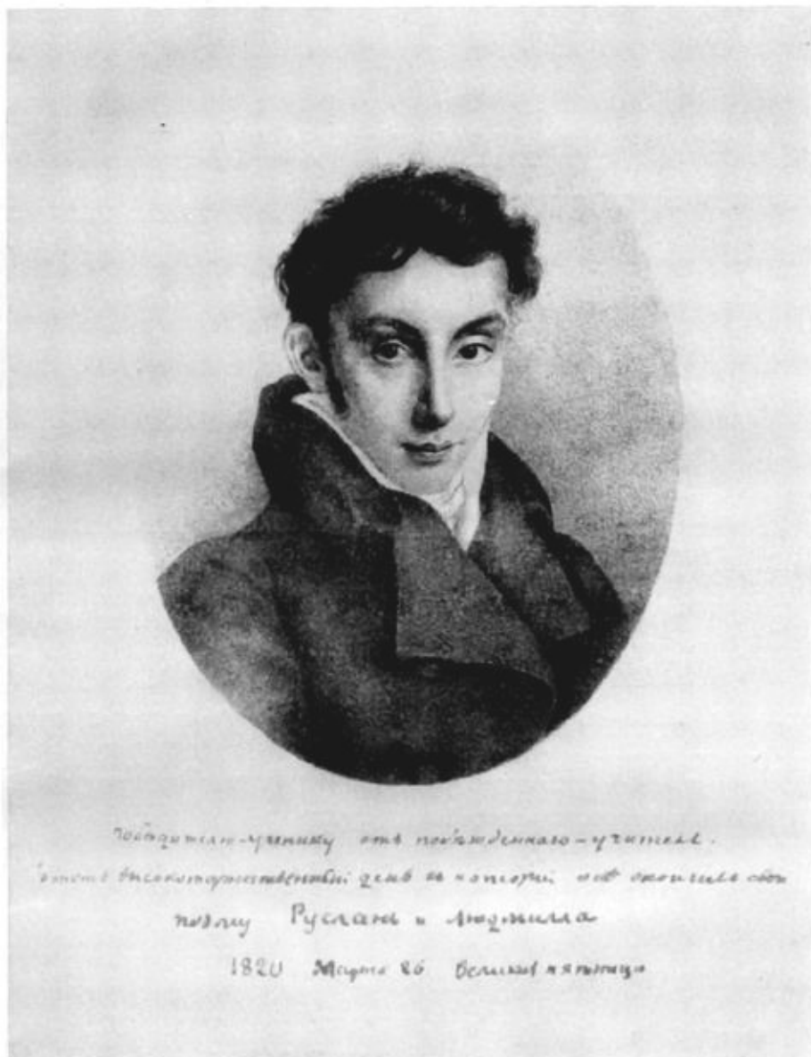
В.А. Жуковский. С литографии Эстеррейха (1820)